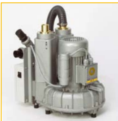
VAC III: Trocken-Absaugung mit Anschlusskasten, Kondensatabscheider: 3-5 Behandlungsplätze

VAC III Saugsystem: Bestell-Nr.: 04010003 VAC III Motor, ohne Anschlusskasten: Bestell-Nr.: 04010006