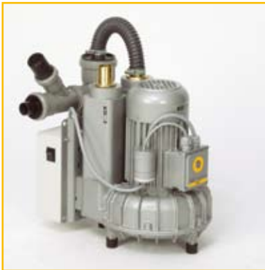
VAC I: Trocken-Absaugung mit Anschlusskasten, Kondensatabscheider: 1 Behandlungsplatz

VAC I Saugsystem: Bestell-Nr.: 04010001 VAC I Motor, ohne Anschlusskasten: Bestell-Nr.: 04010004