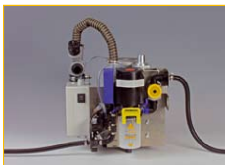
EXCOM ZE: Bestell-Nr.: 02010104