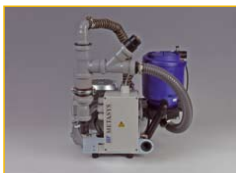
EXCOM Z-ECO Light: Bestell-Nr.: 02020003