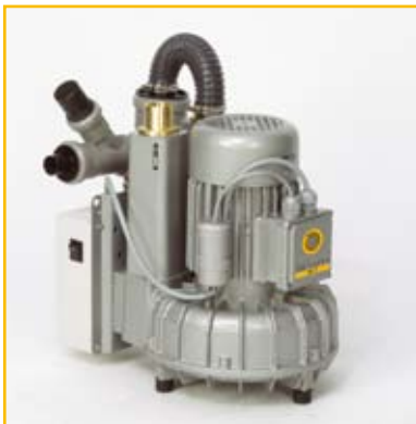
VAC II: Trocken-Absaugung mit Anschlusskasten, Kondensatabscheider: 2 Behandlungsplätze

VAC II Saugsystem: Bestell-Nr.: 04010002 VAC II Motor, ohne Anschlusskasten: Bestell-Nr.: 04010005