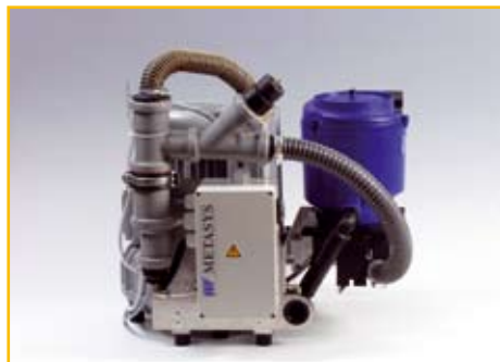
EXCOM Z-ECO: Bestell-Nr.: 02020001