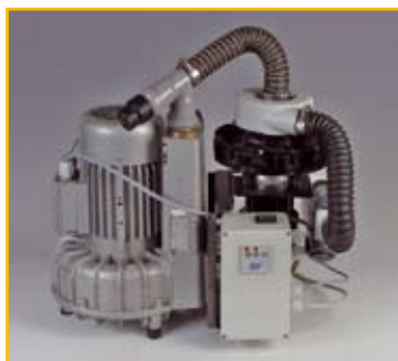
EXCOM Z2: Bestell-Nr.: 02010102