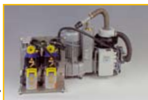
ZA5: Bestell-Nr.: 02010003