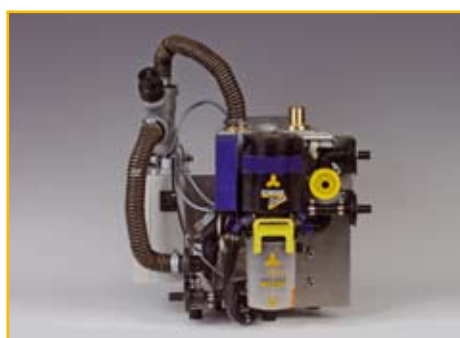
EXCOM ZA1: Bestell-Nr.: 02010004