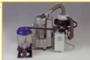
ZA2-ECO II: Bestell-Nr.: 02010005