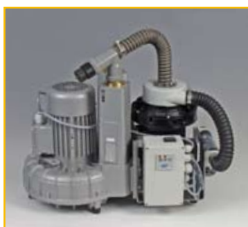
EXCOM Z5: Bestell-Nr.: 02010103