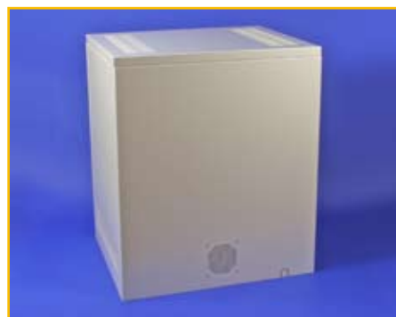
EXCOM Z2/ZA2 Bestell-Nr.: 40030002

METASYS Abdeckung: EXCOM Z2/ZA2, EXCOM ZA2-ECO II, EXCOM Z5/ZA5, EXCOM ZA5-ECO II