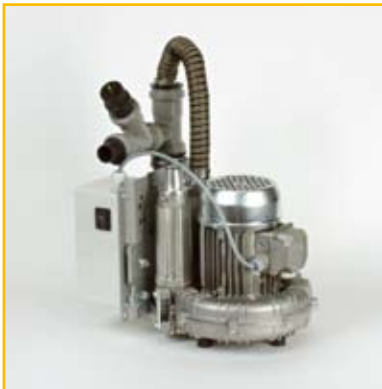
VAC I Light: Trocken-Absaugung mit Anschlusskasten, Kondensatabscheider: 1 Behandlungsplatz

VAC I Light Saugsystem: Bestell-Nr.: 04010007 VAC I Light Motor, ohne Anschluss- kasten: Bestell-Nr.: 04010008