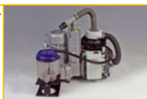
ZA5-ECO II: Bestell-Nr.: 02010006